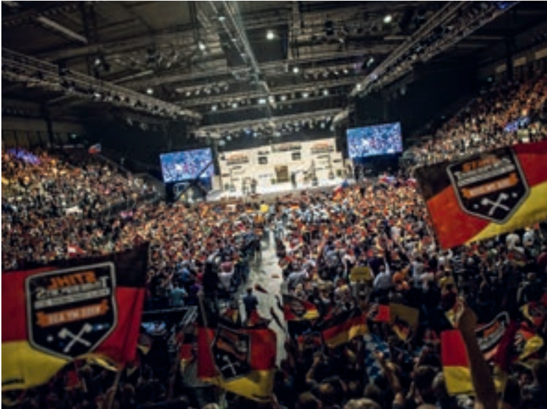
Porsche Arena podczas mistrzostw