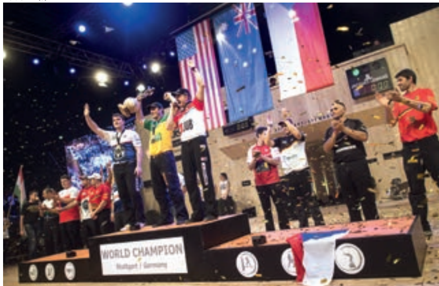
Zwycięcy na podium