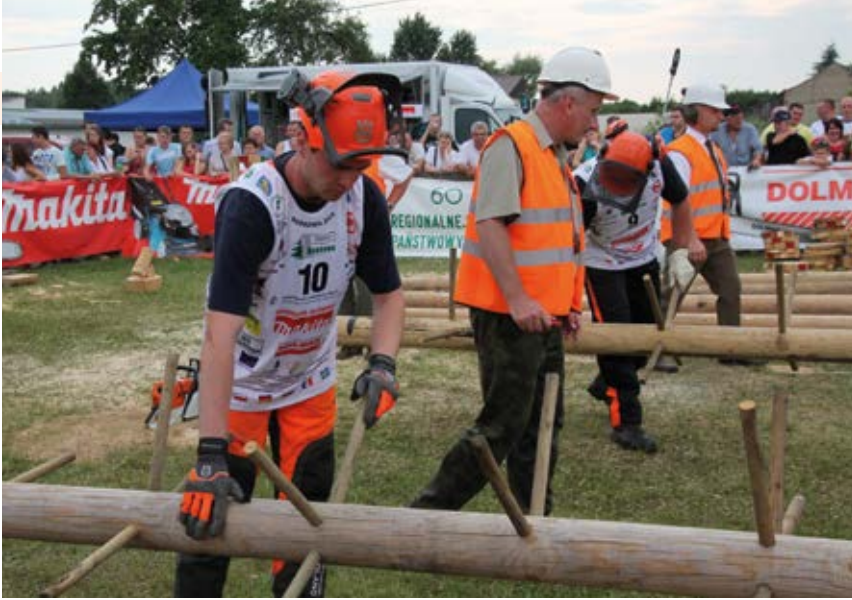
Pełna koncentracja: zawodnicy przed startem w konkurencji okrzesywania