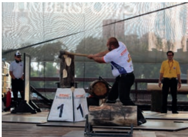
Na tę. Standing Block Chop