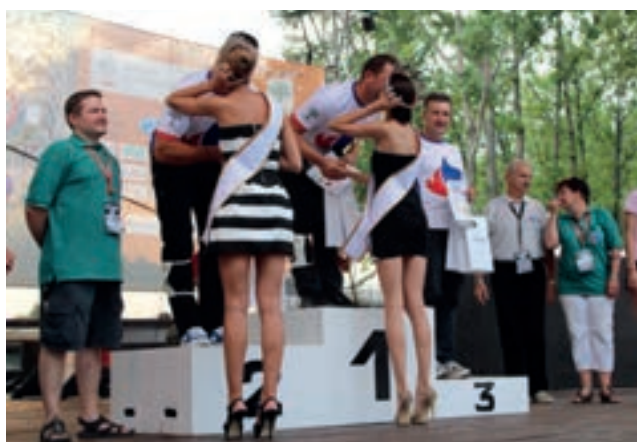
I znów buziak...