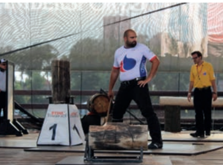
Hmmm... na którą się zdecydować?