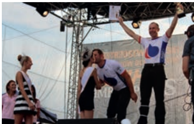
Jak buziak, to buziak