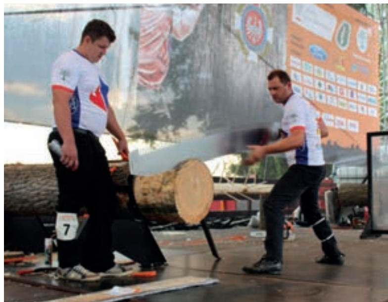
Hmmm... coś nie chce ciąć...

Innych rozmiarach. A skoro o „monstrach” mowa, to w tej kategorii przoduje konkurencja Hot Saw, w której na pierwszy plan wychodzi, zaopatrzona w motocyklowy tłumik, łańcuch z harwestera oraz 62 KM mocy, pilarka, a właściwie PILARKA, którą trzeba obciąć trzy krążki w jak najkrótszym czasie (rekord Polski – 7,8 s.).