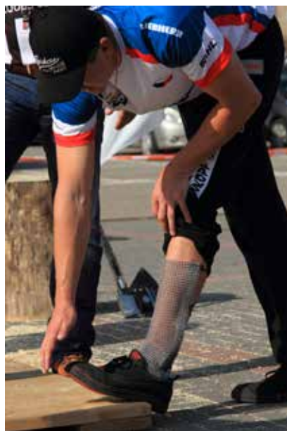
BHP to podstawa!