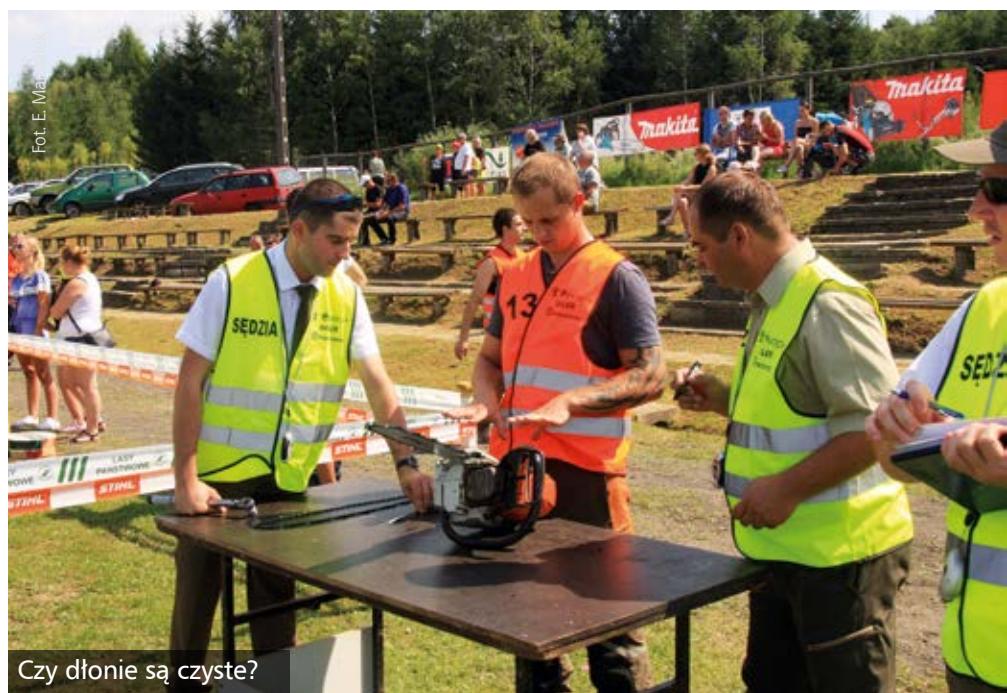
Czy dłonie są czyste?